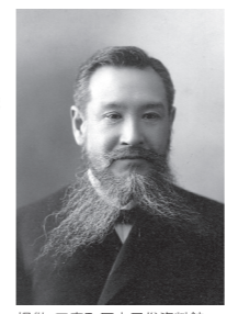
衆議院議員時代の河野広中。

明治初期、全国に広がった自由民権運動。特に福島県は「西の高知・東の福島」と呼ばれるほど高まりが強く、その中心的人物が三春町出身の河野広中でした。彼は県内の区長・戸長を務めたのち、県議会・衆議院へ進み、国の中心で民意に基づく政治を訴え続けました。今では18歳以上の国民が持つ選挙権も、実は彼無くして語れないものなのです。