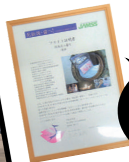
2008年に8か月間の宇宙ミッションを記したフライト証明書。2021年にも、再び種が宇宙を旅するミッションが行われました。

実は宇宙にも行った!? 三春滝ザクラ 日本三大桜の一つとして有名な三春滝桜。大正11年に桜の木として初めて国の天然記念物に指定され、令和4年に100周年を迎えました。そんな滝桜、実は宇宙を旅したことも！2008年、滝桜等の種を国際宇宙ステーション「きぼう」に運び、およそ8カ月の滞在後、地球へ帰還。その種は町内の小学校などに植えられ「宇宙ザクラ」として日々成長し続けています。