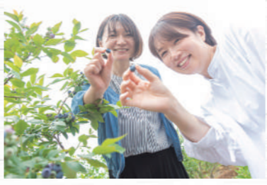
低木なので、女性や子どもたちも摘み取りやすい!

ブルーベリーの里とも呼ばれる三春町は、かつて桑や葉タバコの栽培が盛んでした。その畑を利用して、新しい特産品となったのがブルーベリー。日当たりの良い丘陵地を利用した農園は現在6カ所あり、栽培と摘み取り体験を行っています。令和4年は6月25日に一斉にオープンし、8月中旬頃までの期間、様々なブルーベリーを楽しめます。農園によって栽培している品種が異なるので、食べ比べもオススメです!詳しい場所は左ページで☆