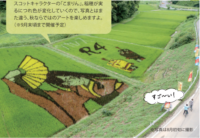
🚲 [場所] 三春町大字鷹巣字玉ノ沢110

令和4年は三春町内2カ所で開催中の田んぼアート。鷹巣(たかのす)地区は一番の大きさを誇り、2022年の図柄は「愛姫」と、三春町マスコットキャラクターの「こまりん」。稲穂が実るにつれ色が変化していくので、写真とはまた違う、秋ならではのアートを楽しめますよ。(※9月末頃まで開催予定)