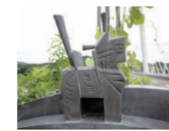
町内の至る所にも、モチーフにしたオブジェが！