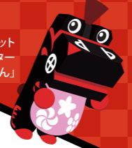
三春町マスコットキャラクター「こまりん」

町のシンボル・滝桜を始め、三春町には色々な名物や名所がたくさん！ 三春駒やだるまなどお馴染みのものから、 三春町出身の偉人、観光スポットの あまり知られていないトリビアを紹介します♪