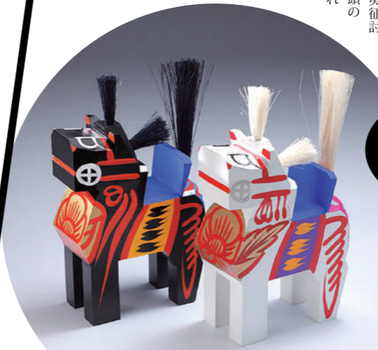
年賀切手に日本で最初に採用された民芸品（昭和29年）でもあります。

黒は子宝・子育て、白は長寿のお守りになる三春駒 こまりんのモデルでもある三春駒。由来は、平安時代の武官、坂上田村麻呂が蝦夷征討で苦戦中、突然百頭の馬が現れて助けられたという伝説から、子どもの玩具として作られたのが始まりだそう。白の三春駒は、三春大神宮の白馬像をモチーフに作られるようになった。