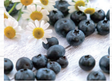
果実が大きく、酸味と甘みのバランスが良い「ハイブッシュ系」という品種が主に栽培されています。