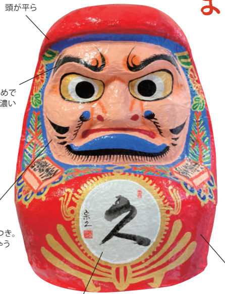
頭が平ら 肩は長めでヒゲが濃い 彫りの深い顔つき。災いも逃げちゃう厳しい顔 背の高い東北型

三春の家では年々成長する!? 三春だるま 「三春だるま（別称高柴だるま）」は最初から目が入り、赤みを帯びた顔に青い縁取りが特徴です。5、6cmの小さいものから約1mまで様々な大きさがあり、各家庭では1月のだるま市に合わせて、去年より少し大きくなるだるまを新調する習慣があります（1年毎に増やして飾る家庭も多いそう！）