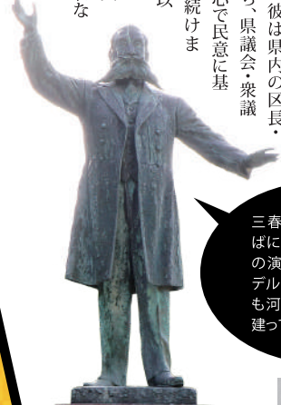
三春町自由民権ひろばにある銅像は、晩年の演説会の写真がモデル。福島県庁東側にも河野広中の銅像が建っています。