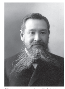
衆議院議員時代の河野広中。

明治初期、全国に広がった自由民権運動。特に福島県は「西の高知・東の福島」と呼ばれるほど高まりが強く、その中心的人物が三春町出身の河野広中でした。彼は県内の区長・戸長を務めたのち、県議会・衆議院へ進み、国の中心で民意に基づく政治を訴え続けました。今では18歳以上の国民が持つ選挙権も、実は彼無くして語れないものなのです。