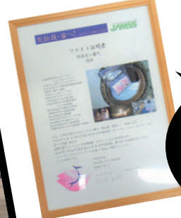
2008年に8か月間の宇宙ミッションを記したフライト証明書。2021年にも、再び種が宇宙を旅するミッションが行われました。

実は宇宙にも行った!? 三春滝ザクラ 日本三大桜の一つとして有名な三春滝桜。大正11年に桜の木として初めて国の天然記念物に指定され、令和4年に100周年を迎えました。そんな滝桜、実は宇宙を旅したことも！2008年、滝桜等の種を国際宇宙ステーション「きぼう」に運び、およそ8カ月の滞在後、地球へ帰還。その種は町内の小中学校などに植えられ「宇宙ザクラ」として日々成長し続けています。