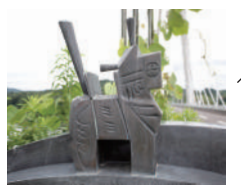
町内の至る所にも、モチーフにしたオブジェが！

黒は子宝・子育て、白は長寿のお守りになる三春駒 こまりんのモデルでもある三春駒。由来は、平安時代の武官、坂上田村麻呂が蝦夷征討で苦戦中、突然百頭の馬が現れて助けられたという伝説から、子どもの玩具として作られたのが始まりだそう。白の三春駒は、三春大神宮の白馬像をモチーフに作られるようになった。