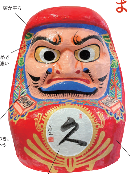
頭が平ら 肩は長めでヒゲが濃い 彫りの深い顔つき。災いも逃げちゃう厳しい顔 背の高い東北型

三春の家では年々成長する!? 三春だるま 「三春だるま（別称高柴だるま）」は最初から目が入り、赤みを帯びた顔に青い縁取りが特徴です。5、6cmの小さいものから約1mまで様々な大きさがあり、各家庭では1月のだるま市に合わせて、去年より少し大きくなるだるまを新調する習慣があります（1年毎に増やして飾る家庭も多いそう！）