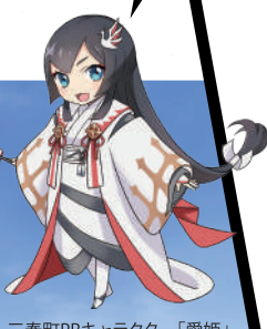
三春町PRキャラクター「愛姫」