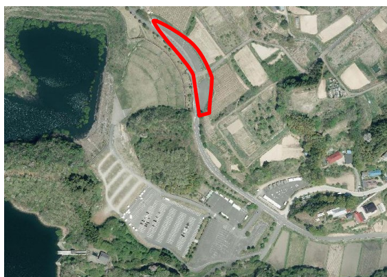
【図5 出店車両駐車場】