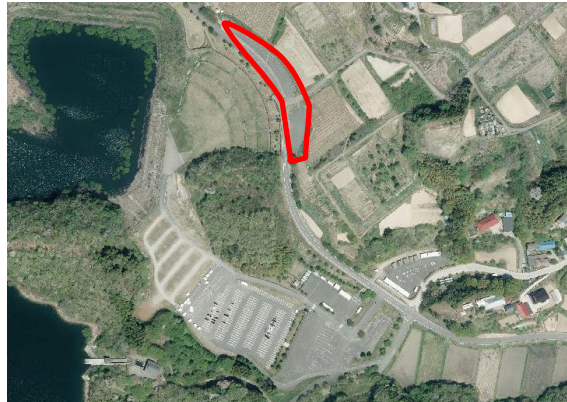
【図5 出店車両駐車場】