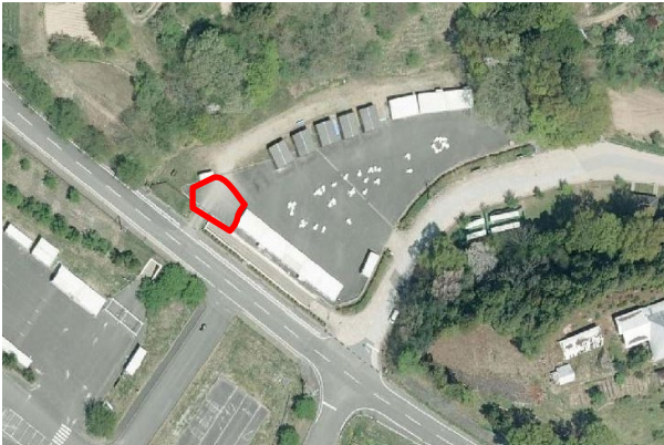
【図4 搬入・搬出エリア(桜久保売店)】