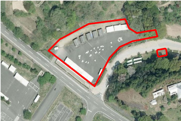
【図1 桜久保売店(桜久保206-2ほか)】